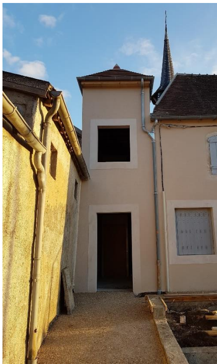
Entrée du monte-personne

Après un bon délai pour obtenir l'accord de l'architecte des Bâtiments de France et réaliser le monte-personne, l'entreprise Tullio a construit un bâtiment autour de celui-ci. Ces travaux ont été réalisés dans de bonnes conditions et en parfaite coordination avec l'ascensoriste. Les travaux se sont poursuivis par la réalisation du cheminement piéton pour les personnes à mobilité réduite.