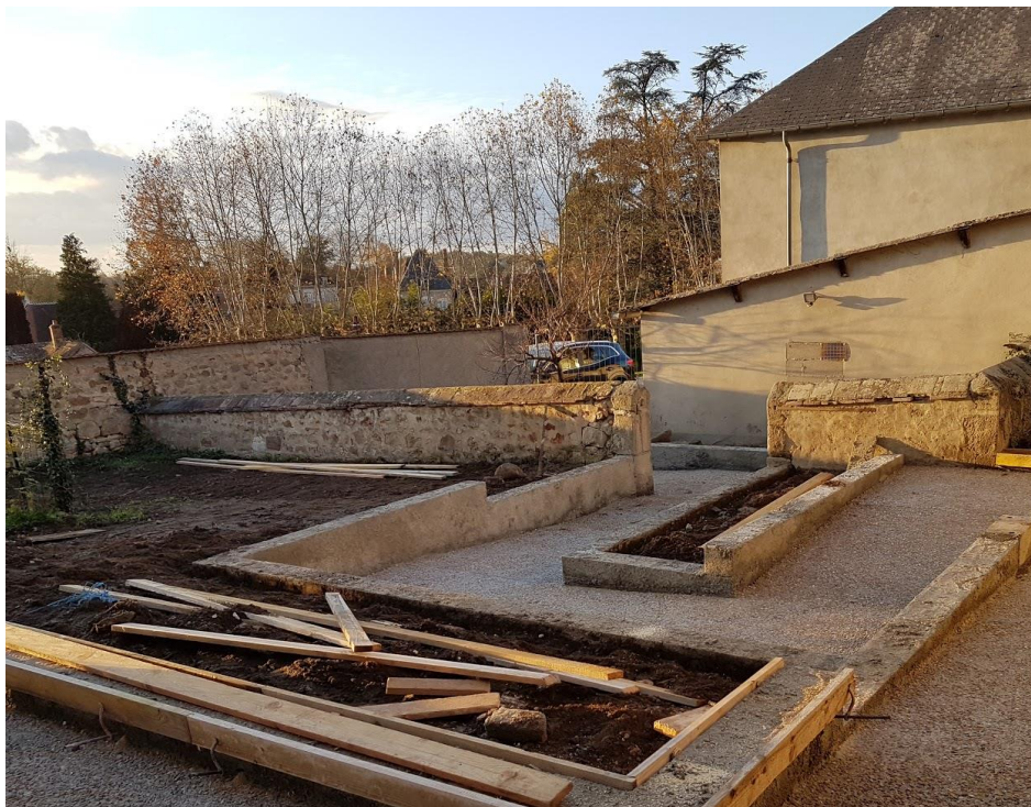
Accès personne à mobilité réduite

Les agents municipaux aménageront par la suite la petite cour intérieure.