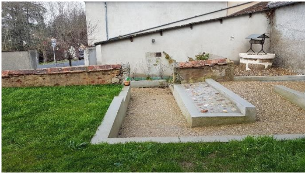
La Cure-cheminement PMR et puits