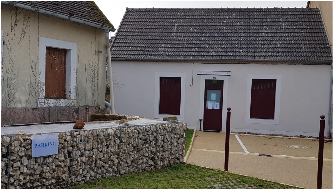
Le local du kinésithérapeute